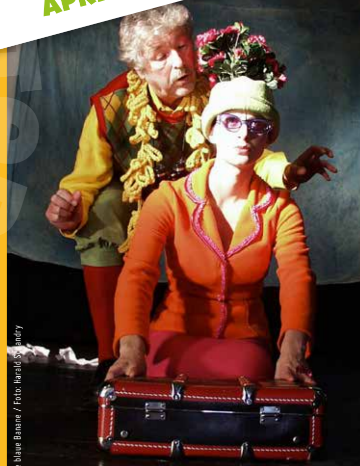
Die blaue Banane