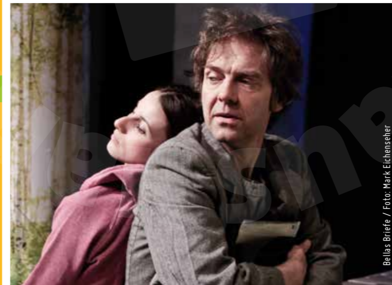
Bellas Briefe